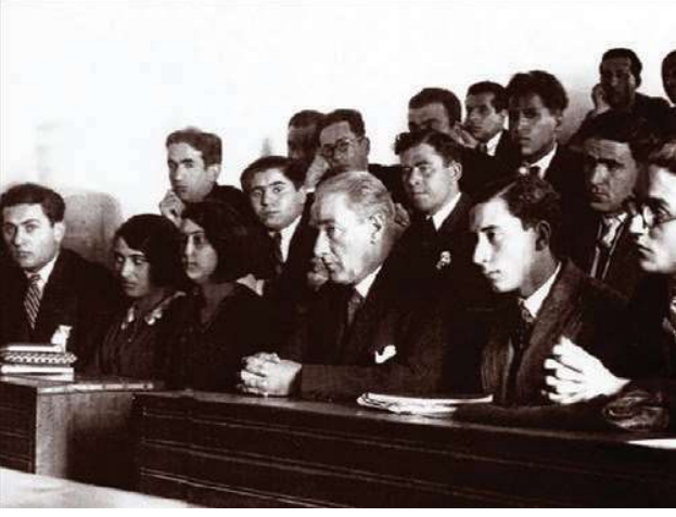
Cumhurbaşkanı Atatürk, 1937 yılında Sivas Lisesi'ni ziyaretinde görülüyor.

yayılan büyük bir kültür devrimi gerçekleştirilmiştir. Yetişkin nüfusun okuryazarlık durumundaki artış bunun en açık göstergesidir. Cumhuriyetin ilk 10 yılında 15 yaşından büyük yetişkin nüfusun %81'i okuma yazma bilmediği kayıtlara geçmiştir. 2022 yılına gelindiğinde yaşanan göç hareketleri de göz önünde tutulduğunda okuma yazma bilmeyen yetişkin nüfusun %2,65'e düştüğü görülmektedir.