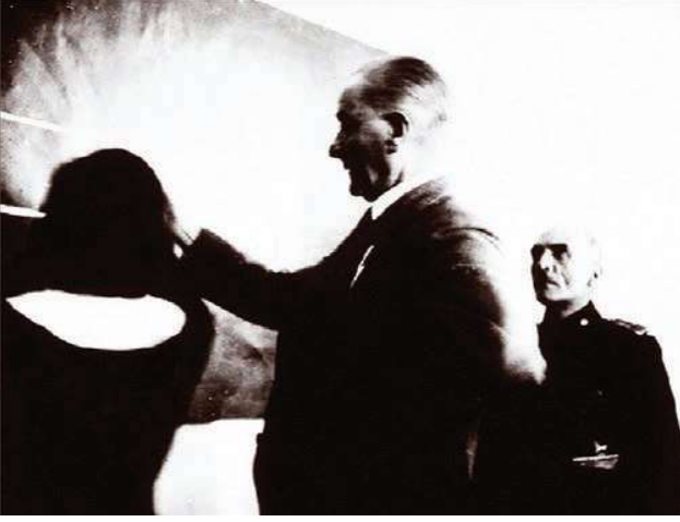
Cumhurbaşkanı Atatürk, 1937 yılında Sivas Lisesi'ni ziyaretinde görülüyor.

İşte bu yüzdendir ki, yüzüncü yılına eriştiğimiz Cumhuriyetimizin Çanakkale'de en açık şekilde kendini gösteren "Millî Ruh" ile Gazi Mustafa Kemal Atatürk'ün ilkeleri ve düşünceleriyle donanmış inançlı yüreklerle, akıl ve bilimi rehber edinen yurttaşlarla büyük heyecanla daha nice yüz yıllara, bin yıllara erişmesini dilerim.